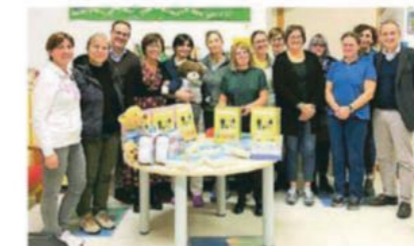
La presentazione di "Con Balù in pediatria la paura scappa via"